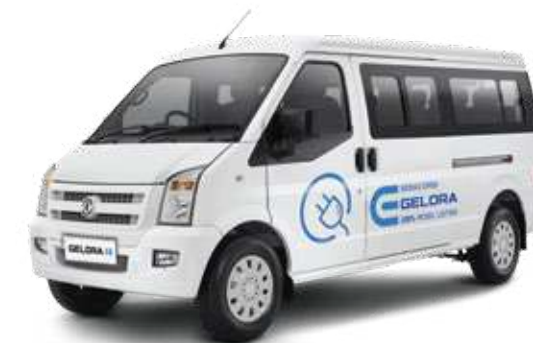
Gelora E - Mini Bus