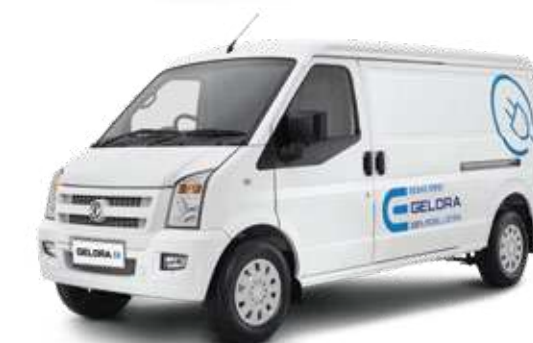
Gelora E - Blind Van